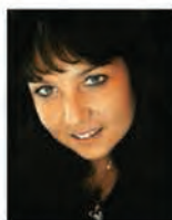
Автор проекта: дизайнер Диана Бахтиярова Проектирование и строительство: «ОЛИМПСТРОЙСЕРВИС»

Квартира общей площадью 140,0 м 2 предназначена для семьи из четырех человек. Особенностью планировочного решения стало объединение кухни, столовой и гостиной в единое пространство. Планировка квартиры предусматривает также большой холл в центре.